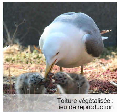
Toiture végétalisée : lieu de reproduction

conception des toitures à regrouper les équipements de toiture susceptibles de faire l'objet d'interventions d'entretien (par exemple changement des filtres des CTA ou des Rooftop) dans une zone dédiée, autant que possible à l'écart des zones susceptibles d'abriter des nids. L'entretien des toitures ne doit pas être réalisé durant la période de nidification des oiseaux de mars à juillet.