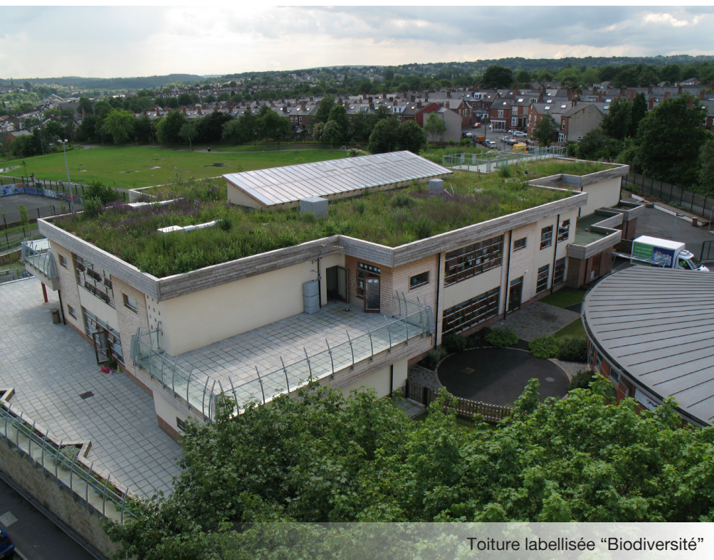
Toiture labellisée "Biodiversité"