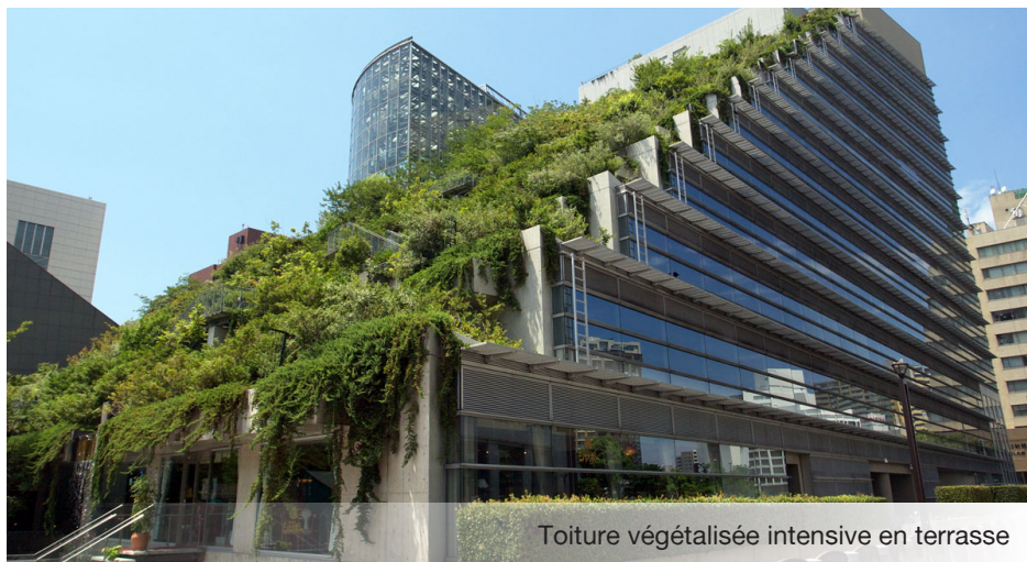
Toiture végétalisée intensive en terrasse

La toiture "biodiversité" permet de créer un réseau réel et plus vaste d'espaces verts et d'habitats fonctionnels au centre des villes. ■