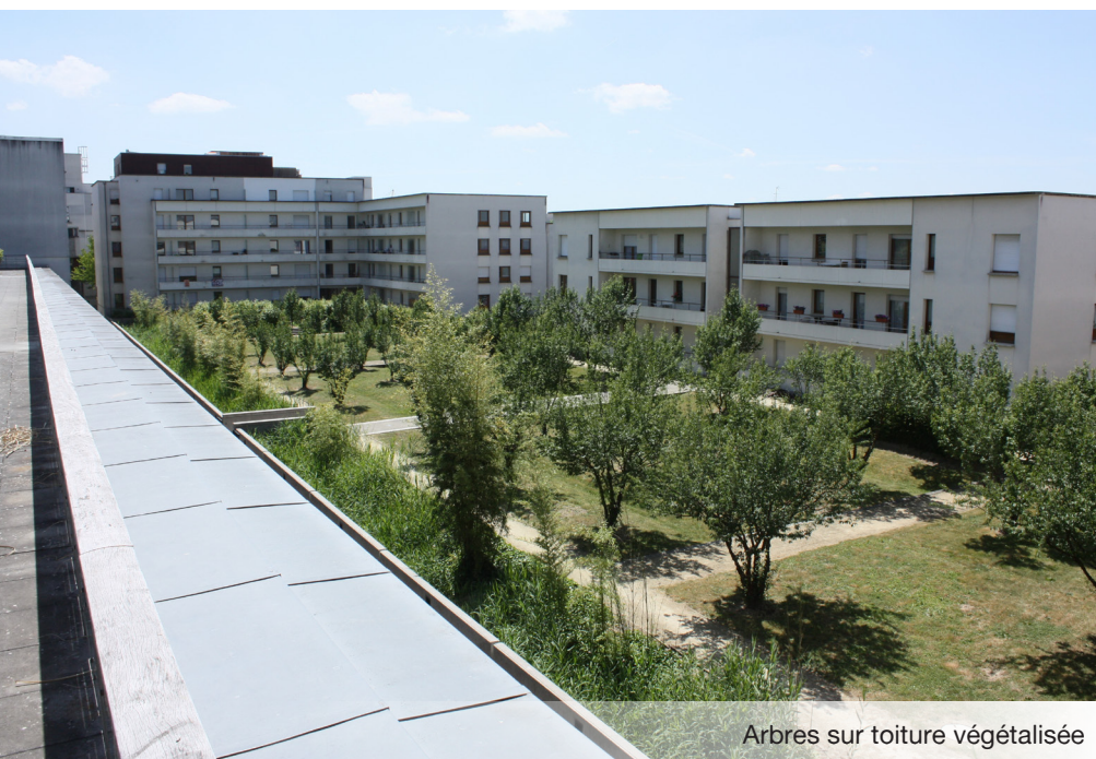
Arbres sur toiture végétalisée

Les toitures végétalisées intensives sont les plus à même de favoriser la biodiversité puisqu'elles peuvent présenter plusieurs strates végétales. Cependant, elles sont coûteuses et difficiles à mettre en place. La toiture "biodiversité" se situe dans la diversité des différentes techniques. Elle doit venir en complément des plantes grimpantes qui prennent les façades d'assaut et des arbres d'alignement qui apportent un peu de nature à nos trottoirs minéraux. Elle est comme une continuité dans le maillage vert qui se veut à plusieurs dimensions.