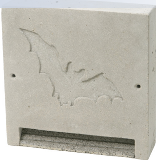
Gîte à chauves-souris