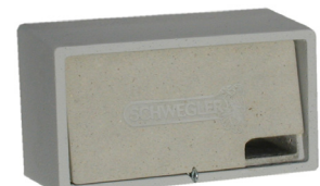
Nichoir à martinets

Ces nichoirs sont à installer au plus haut du bâtiment sans aucun obstacle à proximité du trou d'envol. ■