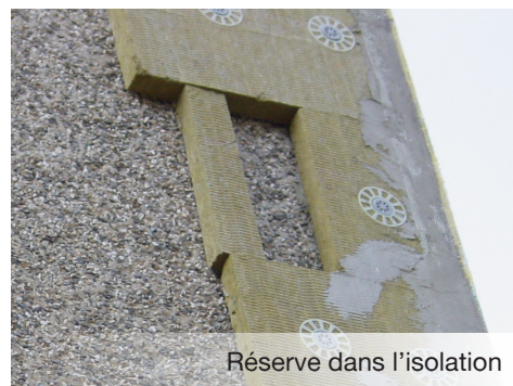
Réserve dans l'isolation

Pour les bâtiments neufs , une réserve dans le béton peut-être prévue afin d'accueillir le nichoir. On veillera à prévoir l'épaisseur de l'isolant sur le mur et dans la réserve afin d'avoir un nichoir affleurant la façade.