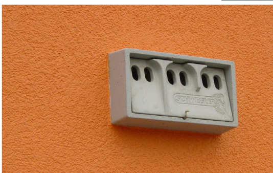
Nichoir à moineaux encastré dans l'isolation extérieure