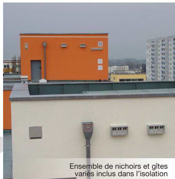
Ensemble de nichoirs et gîtes variés inclus dans l'isolation