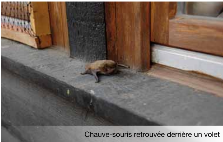
Chauve-souris retrouvée derrière un volet

d'espèces envahissantes, pollinisateurs... L'architecture urbaine peut ainsi apporter des solutions favorisant l'installation de cette biodiversité sans interférer dans ses missions premières.