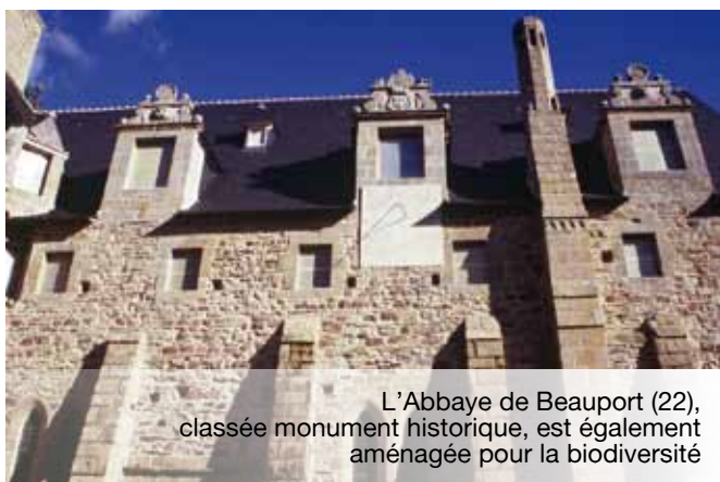
L'Abbaye de Beauport (22), classée monument historique, est également aménagée pour la biodiversité

En cas d'atteinte, des variantes au projet initial ou des mesures d'évitement devront être trouvées. De même, des dérogations peuvent être accordées lorsque le projet se justifie d'un intérêt précis et qu'aucune solution alternative n'est possible. Dans ce cas, il y a obligation de mise en place de mesures compensatoires. Toutefois, les autorités administratives encadrent strictement ces dérogations, de la conception à la réalisation du projet.