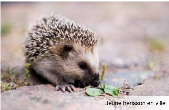
Jeune hérisson en ville

Bien que l'image de la biodiversité véhiculée par les médias renvoie souvent à la richesse biologique dans des contrées lointaines et sauvages... la nature est cependant à nos portes. Celle-ci n'a pas pour autant moins de valeur et elle revêt une importance écologique et sociologique très forte.