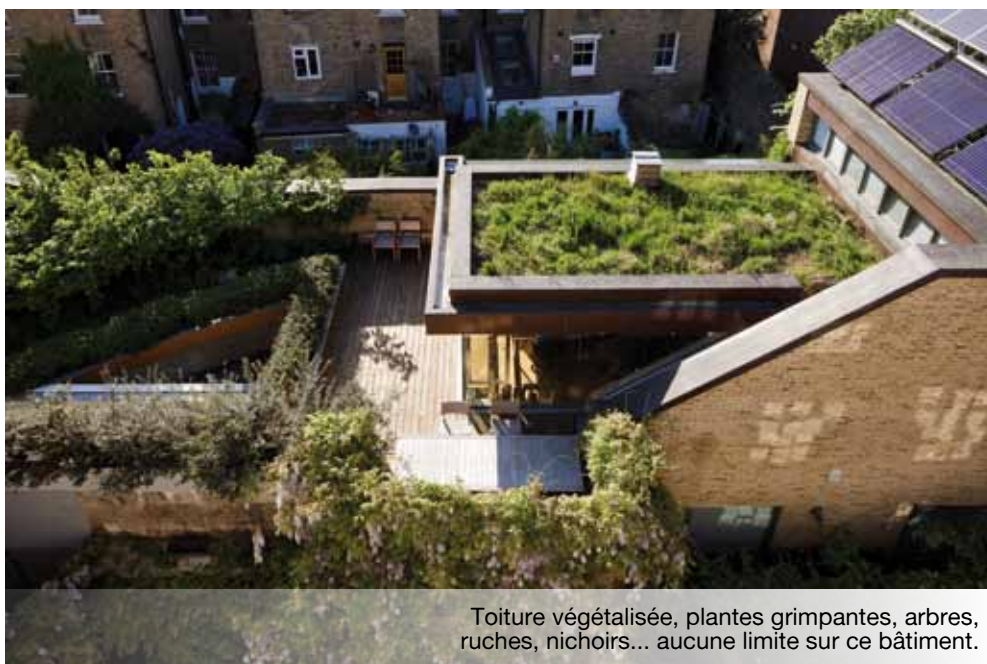
Toiture végétalisée, plantes grimpantes, arbres, ruches, nichoirs... aucune limite sur ce bâtiment.