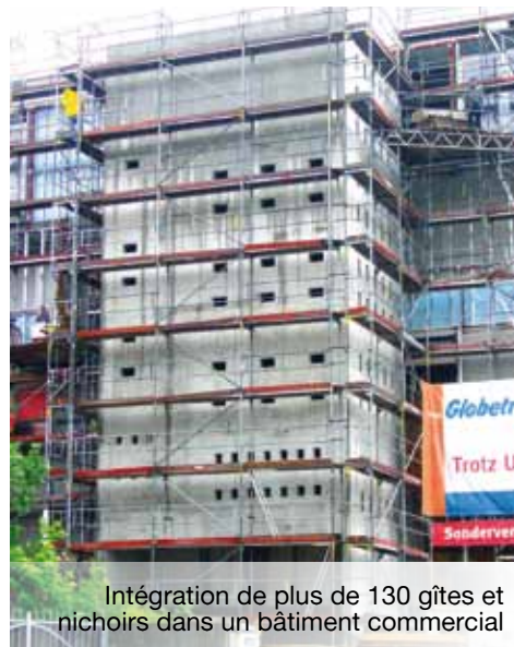
Intégration de plus de 130 gîtes et nichoirs dans un bâtiment commercial

Si certains financeurs invitent à la certification environnementale celle-ci reste néanmoins à l'initiative et à la responsabilité des maîtres d'ouvrage (privés ou publics). Parmi les éco-labels relatifs à la construction, nous pouvons citer le label HQE (en France), BREEAM (au Royaume-Uni), LEED (en Amérique du Nord).