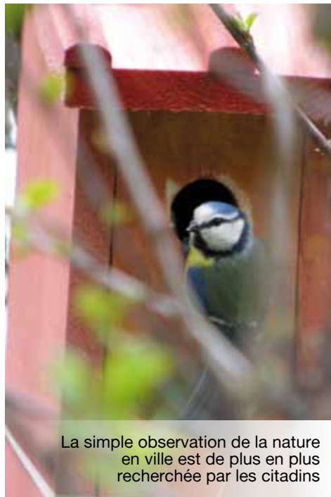
La simple observation de la nature en ville est de plus en plus recherchée par les citoyens

Bien que la préservation de la biodiversité soit actuellement encore peu développée dans ces labels (cible 1 pour le HQE en France par exemple), leurs évolutions prochaines pourraient lui donner une place plus importante.