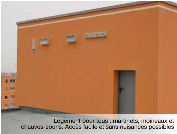
Logement pour tous : martinets, moineaux et chauves-souris. Accès facile et sans nuisances possibles

L'un des facteurs limitant l'implantation de différents groupes faunistiques en ville est le manque de cavités nécessaires à certaines espèces pour y réaliser une partie de leur cycle biologique : reproduction, hibernation, protection contre les intem-