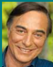
Allain BOUGRAIN-DUBOURG Président de la LPO

La cohabitation entre l'homme et la nature est possible, même au cœur des villes, et cet ouvrage nous donne la marche à suivre.