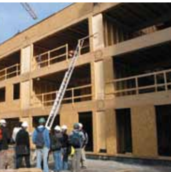
Le bois, un matériau naturel, peut aussi être utilisé sur des bâtiments collectifs