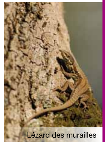
Lézard des murailles

Bien que certaines espèces d'amphibiens (rainette) aient été observées dans « des mares sur les toits » dans le sud de la France, ce groupe zoologique est peu concerné par les actions sur le bâti. Seuls les lézards (lézards des murailles et catalan) et les geckos (tarente, hémidactyle) peuvent potentiellement y trouver gîte dans les interstices et nourriture.