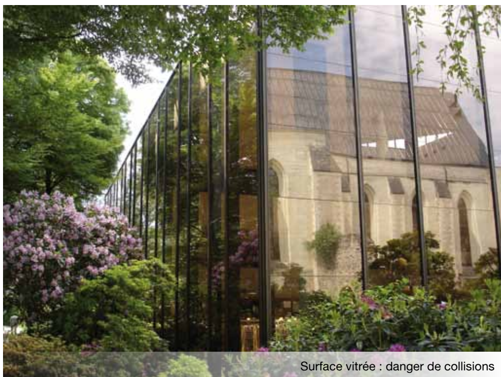
Surface vitrée : danger de collisions