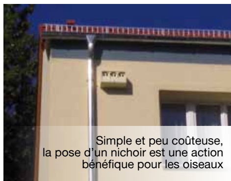
Simple et peu coûteuse, la pose d'un nichoir est une action bénéfique pour les oiseaux

La préservation de l'environnement et la recherche de nature en ville est une demande sociale forte des habitants. Elle a été relayée, pour des raisons environnementales, au travers des changements de pratiques dans les politiques de la ville ces dernières années.