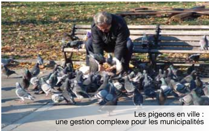
Les pigeons en ville : une gestion complexe pour les municipalités

Afin d'éviter des mesures prises en application du pouvoir de police, les dispositions législatives et réglementaires prévoient des mesures de prévention dans un document que chaque département doit adopter. Il s'agit des règlements sanitaires départementaux.