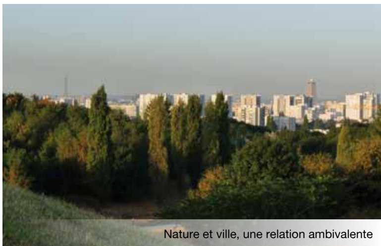
Nature et ville, une relation ambivalente

La prise en compte environnementale au travers de l'ensemble des politiques sectorielles du bâtiment, aussi bien à l'échelle locale que nationale, européenne ou mondiale n'a jamais été aussi forte. Ce changement de cap, s'il a souvent été vu comme une obligation réglementaire, a également contribué à des changements profonds dans les pratiques des professionnels, particulièrement dans le domaine de la construction et de la rénovation urbaine. Cependant, ces obligations ont permis l'émergence d'innovations techniques et architecturales, de nouveaux procédés ont dynamisé l'emploi dans le BTP et ont finalement apporté une forte amélioration écologique des bâtiments. Nous pouvons ainsi citer les nombreuses améliorations dans le domaine énergétique (isolation), ou concernant les matériaux (bois).