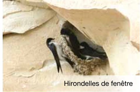
Hirondelles de fenêtre

d'espèces envahissantes, pollinisateurs... L'architecture urbaine peut ainsi apporter des solutions favorisant l'installation de cette biodiversité sans interférer dans ses missions premières.