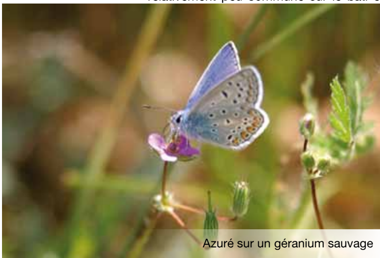
Azuré sur un géranium sauvage

Bien que capable de coloniser spontanément des milieux vierges, la flore est relativement peu commune sur le bâti et