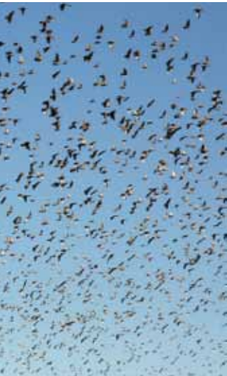
Vol d'étourneaux en hiver

les questionnements, essentiellement d'ordre sanitaire, que suscite la proximité de la faune et de la flore sauvages chez l'homme.