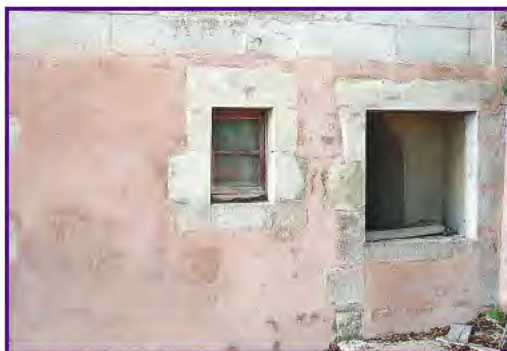
Support avant application du SANIMUR®