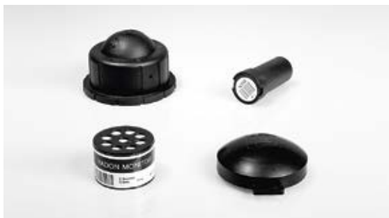
Fig. 3 exemples de dosimètres à radon.