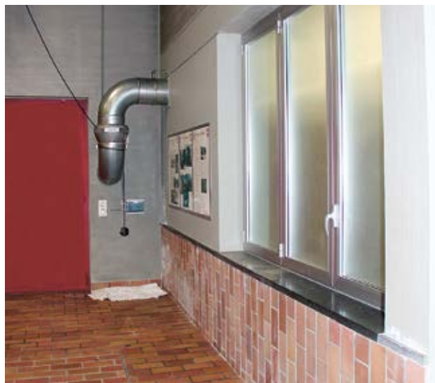
Fig. 6 et 7 les locaux présentant des concentrations élevées de radon sont fermés de façon étanche.

La liste des services de mesure agréés est disponible sur www.ch-radon.ch .