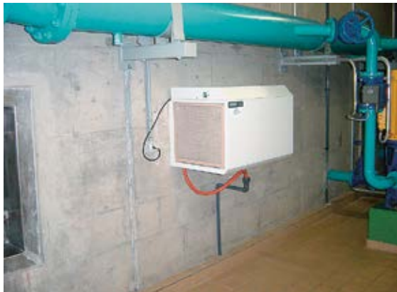
Fig. 2 déshumidificateur avec un filtre sur lequel les produits de désintégration du radon peuvent s'accumuler.

Les filtres de ventilateurs ou de déshumidificateurs constituent un autre danger (fig. 2): comme les produits de désintégration du radon s'attachent aux particules en suspension dans l'air, ils sont aspirés par les appareils et s'accumulent sur le filtre. Si une personne manipule ce dernier (par ex. pour le remplacer), elle peut être contaminée et absorber les substances radioactives.